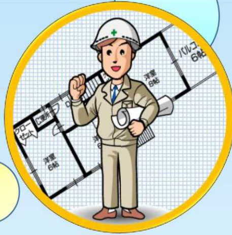
増築・改築・改装