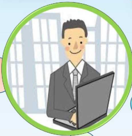
オフィスの移転 間仕切りの変更